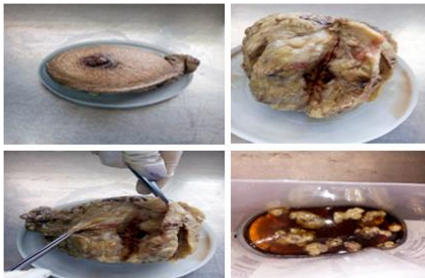
Fig. 1. Estudio macroscópico del espécimen quirúrgico. Fotos tomadas con el permiso de la paciente.

En la descripción microscópica (Fig. 2) se observa marcado pleomorfismo celular y nuclear, presencia de necrosis y extensas áreas de hemorragia, recuento mitótico de más cinco mitosis por campo microscópico a mediano aumento. Invasión perineural, invasión de vasos sanguíneos, infiltrado inflamatorio peritumoral ligero y desmoplastia ligera. No infiltración de la piel de la areola y pezón. Total de ganglios 21 y ninguno metastásicos. Diagnóstico definitivo de angiosarcoma mamario derecho de alto grado de malignidad. La paciente se envió al Hospital Oncológico Conrado Benítez para tratamiento adyuvante donde recibió cinco ciclos de quimioterapia con paclitaxel (taxol) y 25 secciones de radioterapia. Actualmente se encuentra con estado de salud aceptable sin evidencias de actividad tumoral metastásica y en seguimiento oncoespecífico.