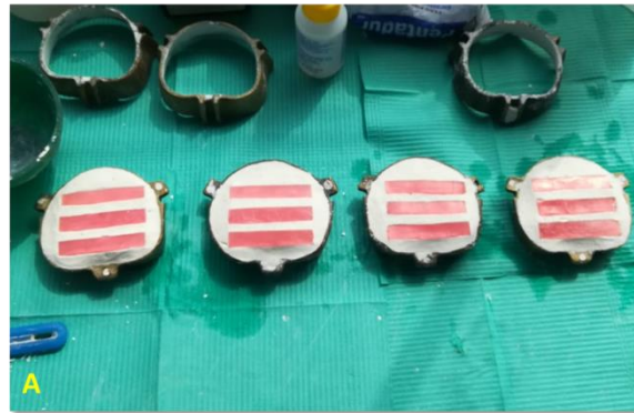
Fig. 1. Enmuflado de las barras de cera.

tuvieron estas dimensiones: 64 mm de largo, 10 mm de ancho y 2,5 mm de grosor. Para la elaboración de las 20 barras de resina acrílica primero se realizaron láminas de cera cavex con las mismas dimensiones que se deseaban para las resinas acrílicas, para el caso de la resina acrílica de termocurado (Vitacryl) y la resina acrílica flexible superpoliamida (Deflex Classic SR) las láminas de cera fueron enmufladas en filas de cuatro barras de cera por mufla, agregándole un bebedero para posteriormente insertar el material acrílico por medio de la técnica de la cera perdida (Fig. 1).